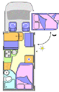
Chausson Flash 06 (Teilintegriert)